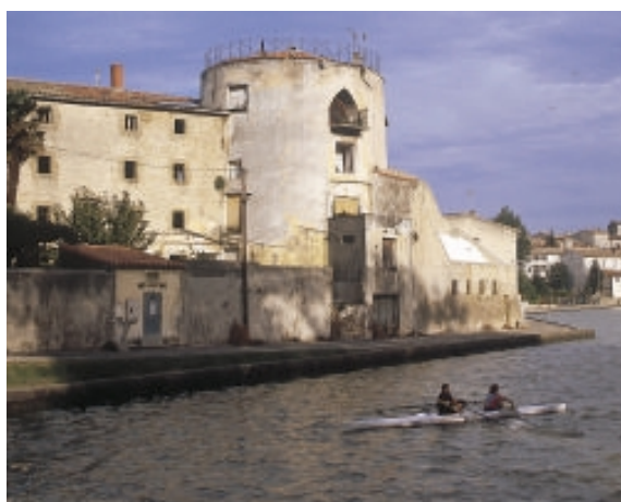
La vinaigrerie sur le Grand Bassin de Castelnaudary.

Loin de se limiter à une simple description des modèles architecturaux et paysagers, la charte, propose des préconisations pour, non pas figer le Lauragais comme un musée, mais au contraire conforter une identité lauragaise tout en laissant la porte ouverte à des apports en concordance avec l'évolution de la population.