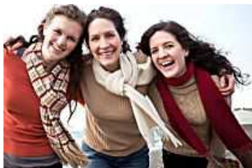
Ces 12 choses à dire absolument à notre fille (Victoria)