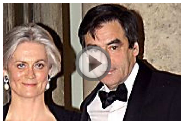
VIDEO - François Fillon : son frère a épousé la soeur de sa femme (Gala)