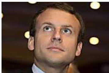
Emmanuel Macron : les conseillers judiciaires qui se préparent dans l'ombre (L'Obs)