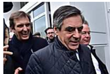
Le suicide de Fillon (L'Obs)