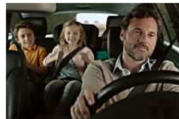
Vous roulez moins de 8000 km/an ? AXA a une très bonne nouvelle ! (AXA)