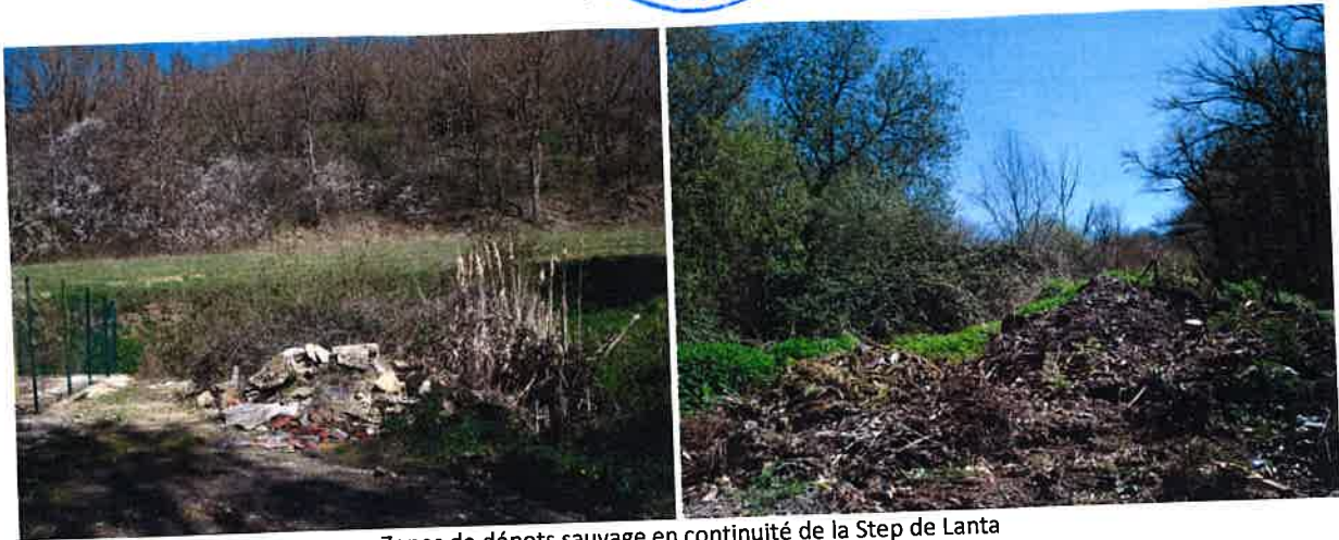
Zones de dépôts sauvage en continuité de la Step de Lanta

Ces éléments artificiels (STEP / dépôts) sont présents au sein de « l'espace de grande qualité » identifié au sein du SCOT et posent dès lors question à la commune de Lanta sur leur maintien dans ce classement.