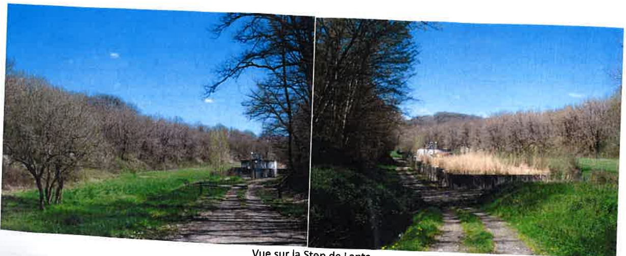
Vue sur la Step de Lanta

La STEP s'accompagne d'un chemin d'accès ainsi que de zones de dépôts sauvages ; et ce malgré l'interdiction de dépôts sauvages. C'est pourquoi la commune de Lanta souhaite compléter son équipement public de STEP par une déchetterie afin de répondre aux besoins et de réduire les pressions sur l'environnement liés aux dépôts sauvages présents.