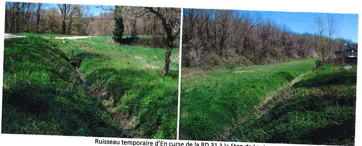
Ruisseau temporaire d'En curse de la RD 31 à la Step de Lanta

Le cours d'eau intermittent au nord de la Step de Lanta correspond au ruisseau d'En Curse. Il s'agit d'un ruisseau temporaire, busé à l'intersection avec la RD 31, et qui ne présente ainsi aucune ripisylve jusqu'à l'est de la STEP. Son intérêt écologique et sa fonctionnalité sont dès lors fortement limités.