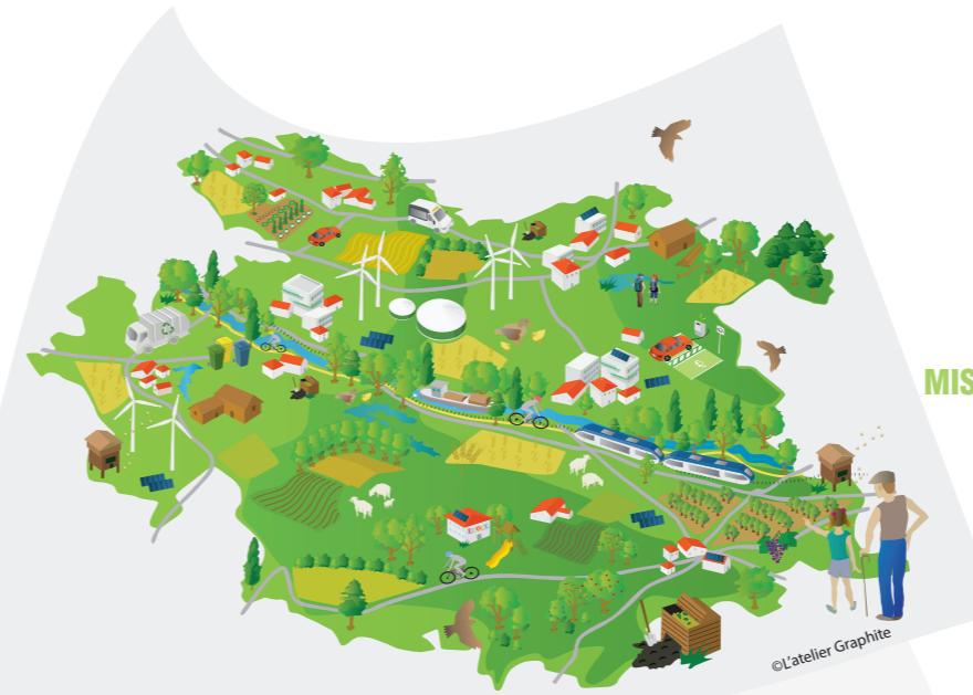
PETR du Pays Lauragais à horizon 2030-2050

La facture énergétique par habitant en 2015 était de 1 569 € (comprenant l'habitat et les déplacements hors loisirs)