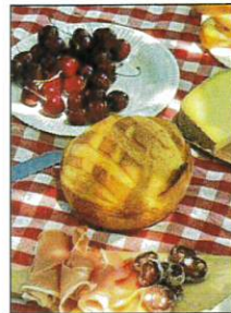
Durant le tournage... - Crédits :

VNF et le SICOVAL, partenaires financiers hors cadre